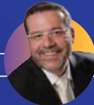
ישראל פרנס הזמר החסידי