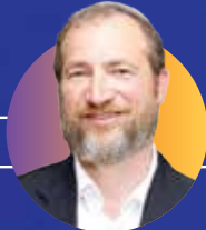
הרב שמואל סלוטקי רב ומחנך, אבי הלוחמים הגיבורים, נעם ישי הי"ד