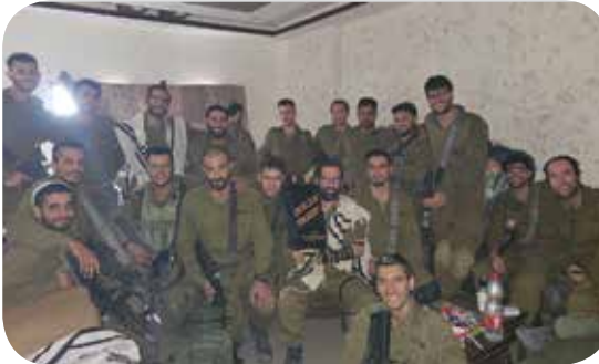
מלחמה למען כלל ישראל בעזה

נפשו למען העם והארץ, על השייכות הגדולה לכלל ישראל ועל כמה שה' משגיח עליהם בזכות מעשיהם הגדולים למען ישועת הכלל, הם צריכים שיגידו להם איזו נשמה גדולה ואידיאלית יש להם, נשמה של דור גאולה. בתחילת המלחמה ניגש אליי קצין מסורתי ואמר לי שהוא פוחד שבגלל העבירות שלו הוא ימות במלחמה. ניחמתי אותו בדברי הכהן משוח מלחמה שאמר "שמע ישראל אתם קרבים היום למלחמה על אויביכם" ורש"י שם כותב: "אפילו אין בכם זכות אלא קריאת שמע בלבד, כדאי אתם שיושיע אתכם", ובמשך שעה שלמה הסברתי לו את ההבדל בין מוסר